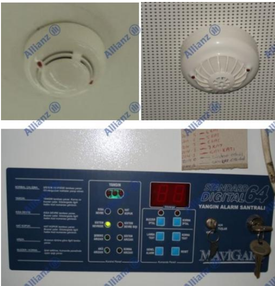
Resim 6 Duman ve ısı dedektörü ile panosu