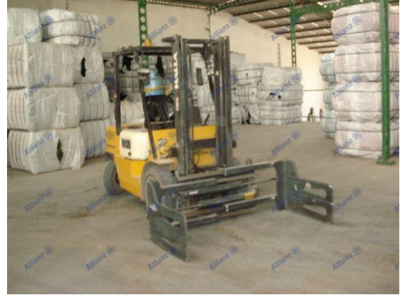
Resim 1 Pamuk balyalarını taşımak için kullanılan forklift

olmalıdır. Şarj cihazı yakın çevresinde kesinlikle depolama yapılmamalıdır.