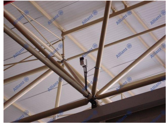
Resim 7 Işın (beam) dedektörü