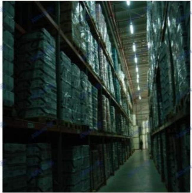
Resim 3 Doğru depolama örnekleri