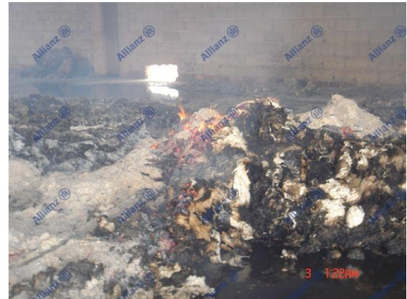
Resim 8 Pamuk deposunun yangından sonraki durumu