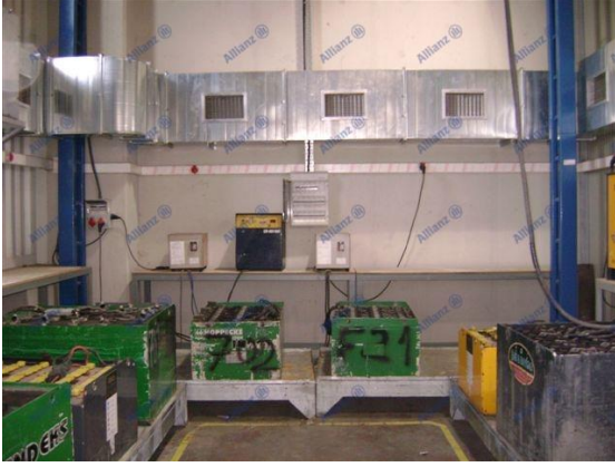
Resim 2 Akü şarj bölgesi (diğer ortamdan ayrılmış, ayrı bir alan)