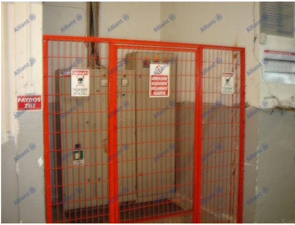
Resim 5 Çevresi tel kafesle çevrilmiş ve ortamdaki ayrışmış elektrik panosu