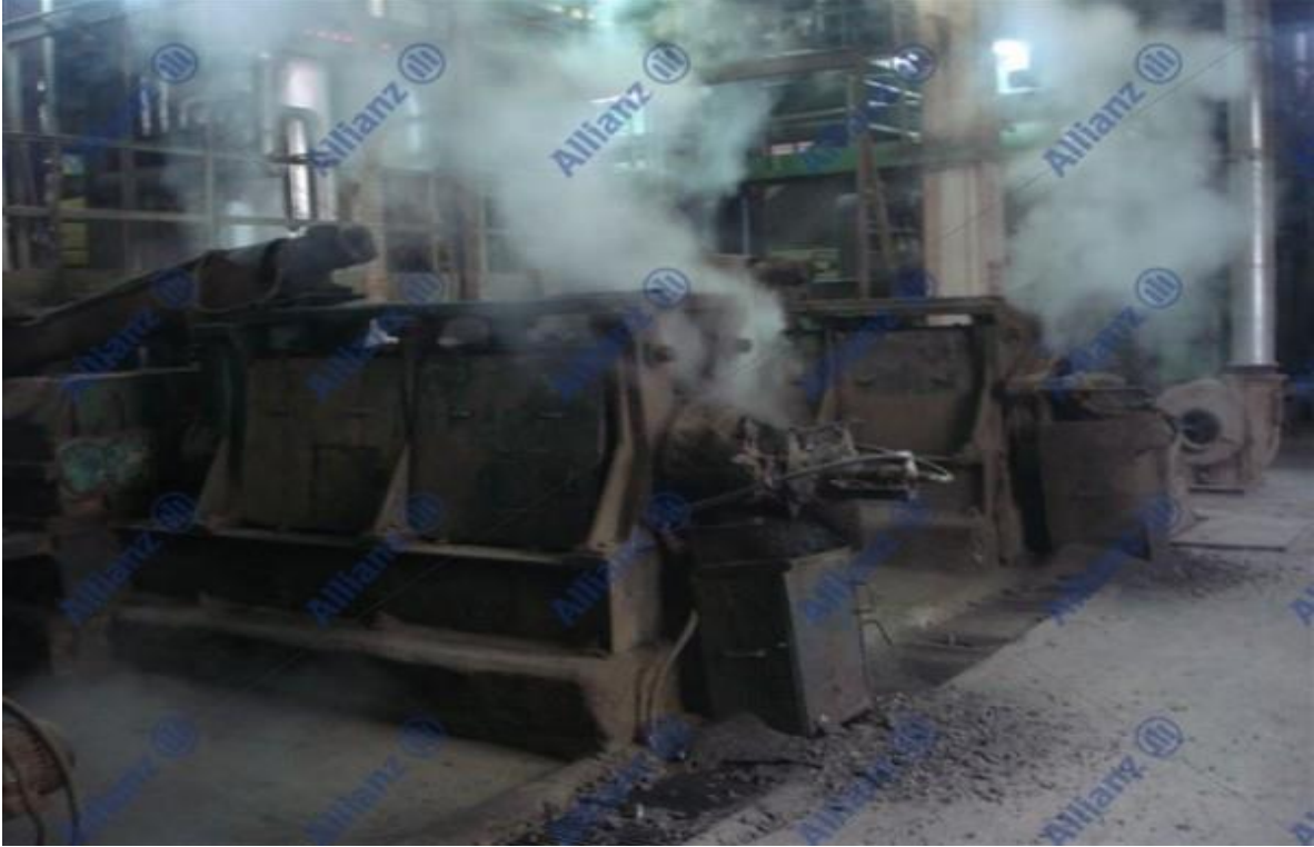
Resim 1.Presleme İşlemi ile Yağ Ayırma

İlk aşama olan hammaddenin mekanik yöntemlerle elenmesi, kırılması ve preslenmesi sonucunda elde edilen ham yağ ile birlikte çıkan yan ürün, yağlı küspedir. Yağın önemli bir kısmı presleme işlemi sonrasında küspede kalmaktadır.