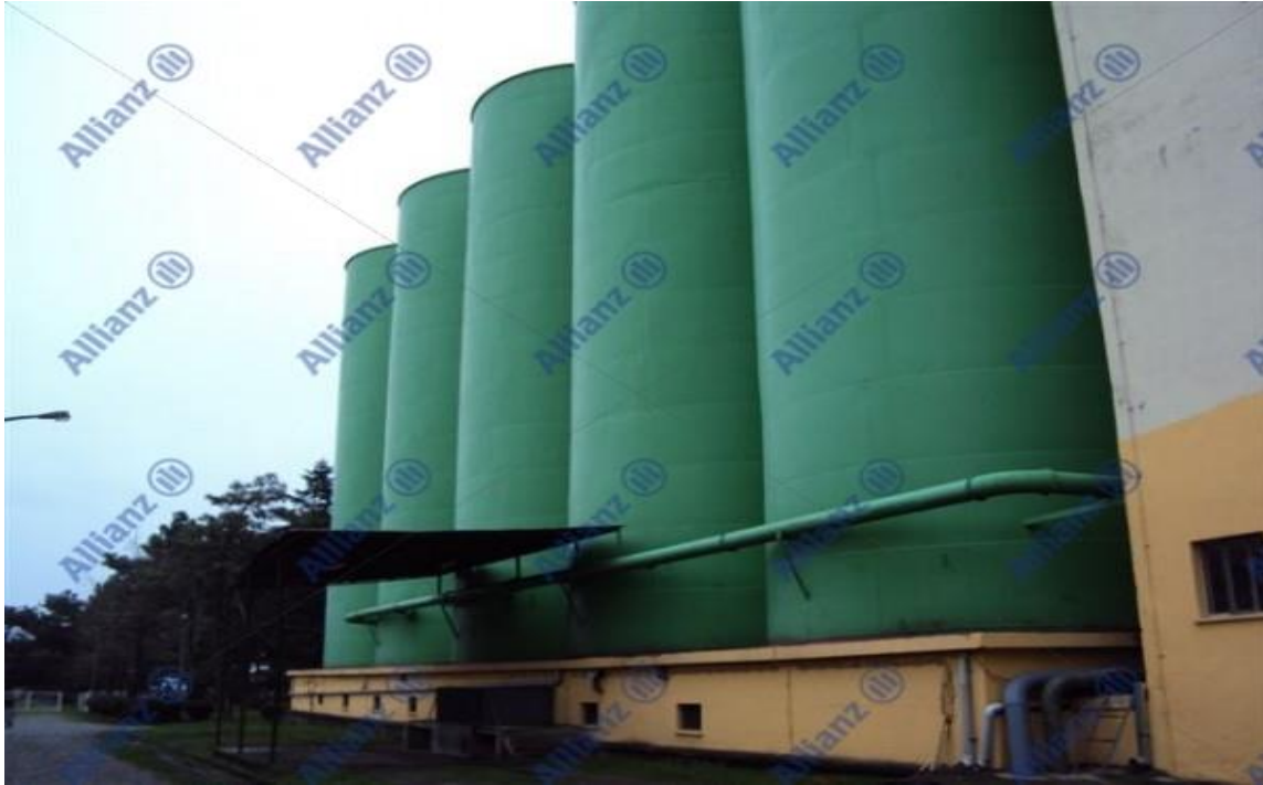
Resim 2. Hammadde Siloları

Solvent yangınlarına suyla müdahale etmek güç olacaktır. Bu tip yangınlar için gazlı ya da köpüklü söndürme sistemleri tercih edilmelidir. Faaliyet gereği üretimin hangi kademesinde yangın çıkarsa çıksın söz konusu yanıcı madde solvent, yağ ve türevleri olacağı için tesis genelinde gazlı ve köpüklü söndürme sistemlerinin tertip edilmesi yangına doğru şekilde müdahale için önemlidir. Binalara uygun mesafede tesis edilecek köpük monitörleri de yangına etkin bir müdahaleye olanak sağlayacaktır.